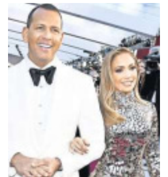
BALD VERHEIRATET: Alex Rodríguez und die Sängerin Jennifer Lopez .