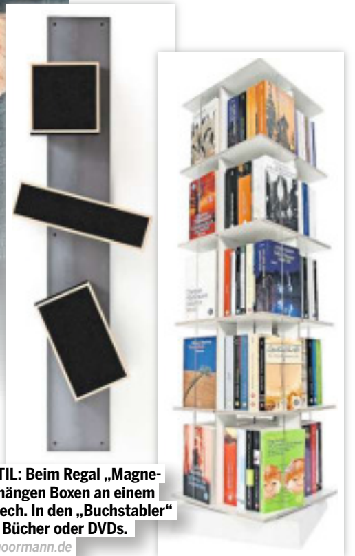
SEIN STIL: Beim Regal „ Magnétique “ hängen Boxen an einem Stahlblech . In den „ Buchstaber “ passen Bücher oder DVDs.