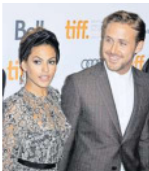
SEIT 2011 EIN PAAR: Eva Mendes und Ryan Gosling sind Eltern von zwei Töchtern.

Schauspielerin und Model Eva Mendes (45) lobt ihren Mann Ryan Gosling (38) als den idealen Erzeuger ihrer Kinder. Bevor sie den Schauspieler kennengelernt habe, sei das Kinderkriegen für sie lange nicht in Frage gekommen. „Dann passierte Ryan Gosling“, sagte die 45-Jährige der US-Zeitschrift „Women's Health“. Und plötzlich habe alles Sinn ergeben: „Nicht Kinder zu bekommen, sondern seine Kinder zu bekommen.“